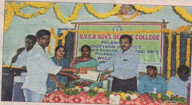
గెలుపొందిన విద్యార్థులకు బహుమతులను పంపిణీ చేస్తున్న దృశ్యం

భవిష్యత్తు రహిత పాగుతా డిగ్రీ రాజేంద్ర స్థానిక డిగ్రీ కళాశాల వారం లావాదేవీ అవసరంపై కార్యకర్తలను పలు